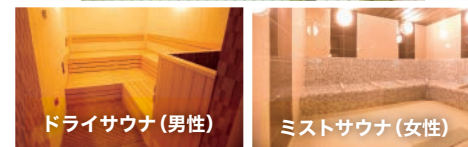
ドライサウナ(男性)