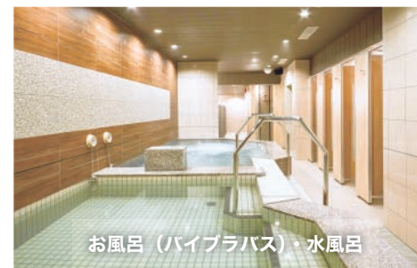
お風呂(ハイバス)・水風呂

光明石の準天然温泉は、疲労を回復して運動後の心と体をリラックスさせてくれます。※人工温泉となります。