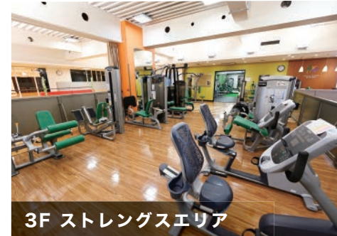
3F ストレングスエリア