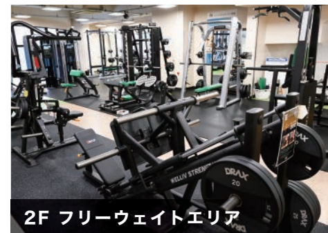
2F フリーウェイトエリア

多種多様な最新マシンであなたのカラダづくりをサポート！もちろん、トレーナーがあなたのフィットネスプログラムをアドバイス。無理をせず、継続するカラダづくりをしましょう。