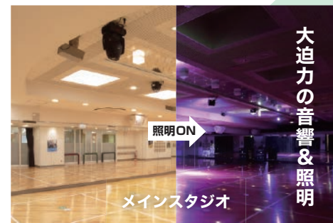
大迫力の音響&照明

大人気のレズミルズや様々な種類のヨガ、ダンスなど多彩なエクササイズプログラムを提供しています。迫力の演出でエクササイズに没頭！