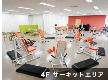
4F サーキットエリア