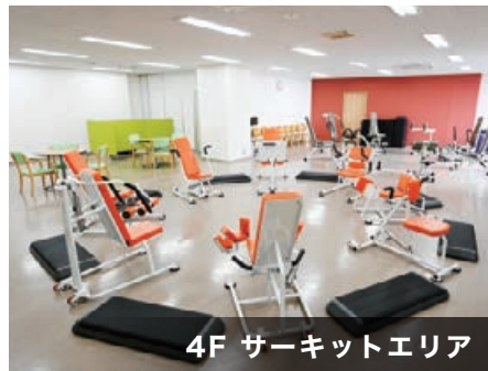
4F サーキットエリア