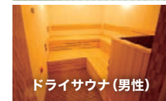
ドライサウナ(男性)