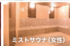
ミストサウナ(女性)