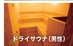
ドライサウナ(男性)