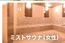
ミストサウナ(女性)