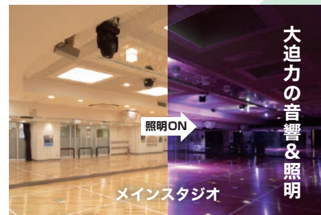
大迫力の音響&照明

大人気のレスミルズや様々な種類のヨガ、ダンスなど多彩なエクササイズプログラムを提供しています。迫力の演出でエクササイズに没頭！